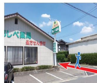
あしべ薬局東側を北に進みます